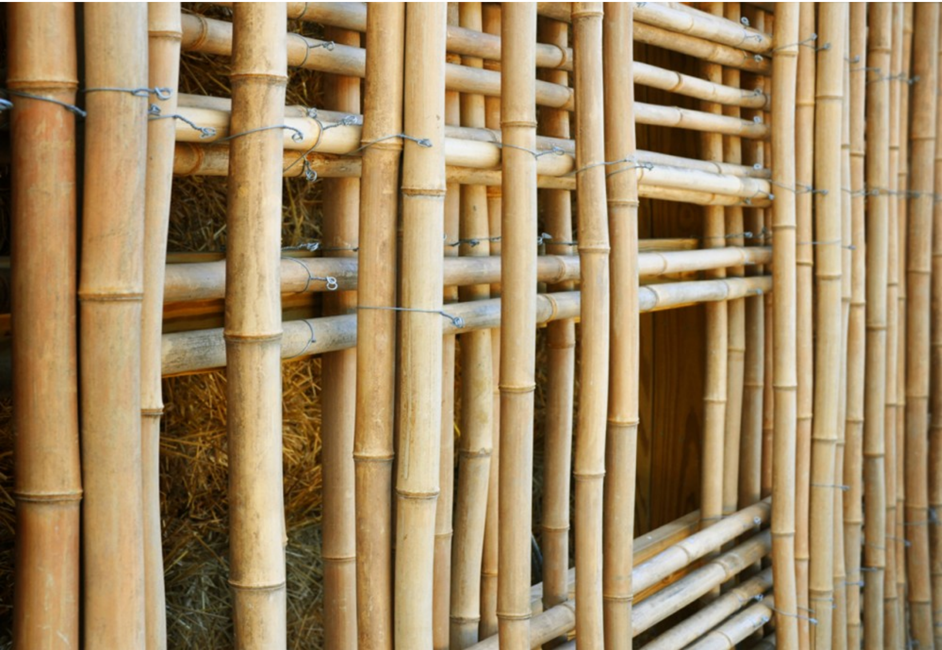
Mason Lane Farm • Goshen, Kentucky, USA • De Leon & Primmer Architecture Workshop • 2009 •