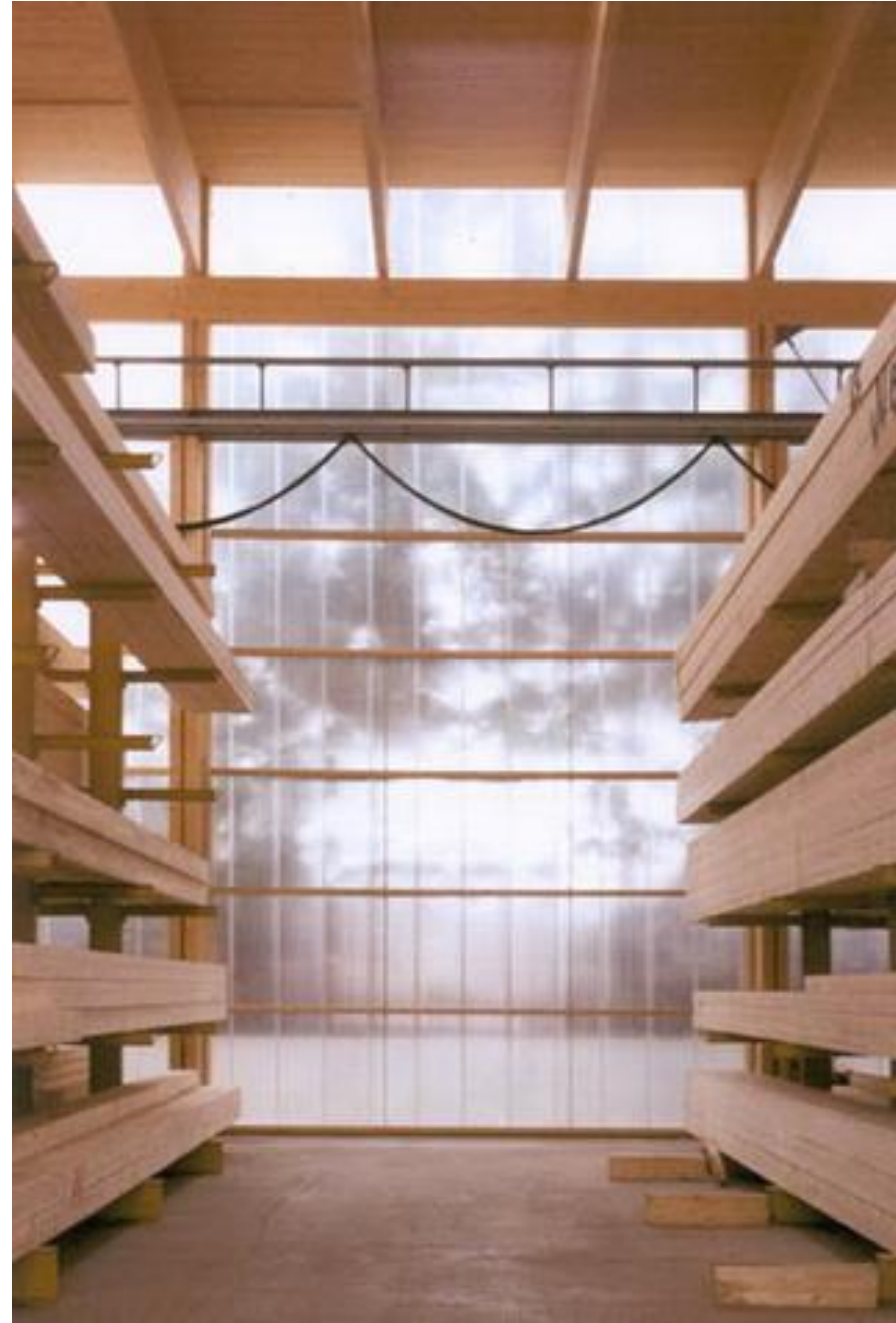
Kufmann Fafeldolgozó Üzem raktára • Bobingen, D • Florian Nagler Architekten • 2001 •