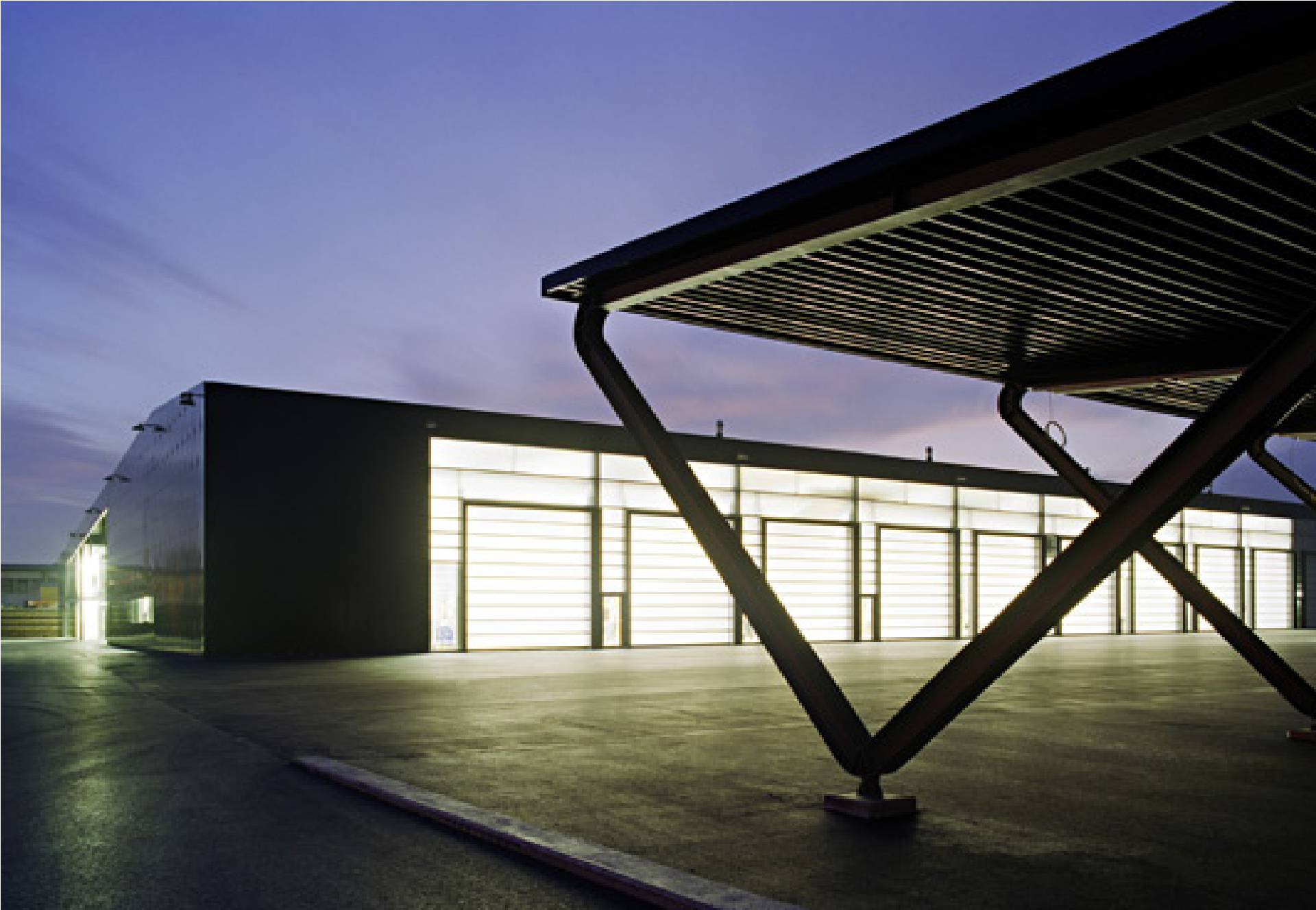
Hulladékhasznosító Üzem • Linz-Ansfelden, A • Caramel Architekten • 2006•