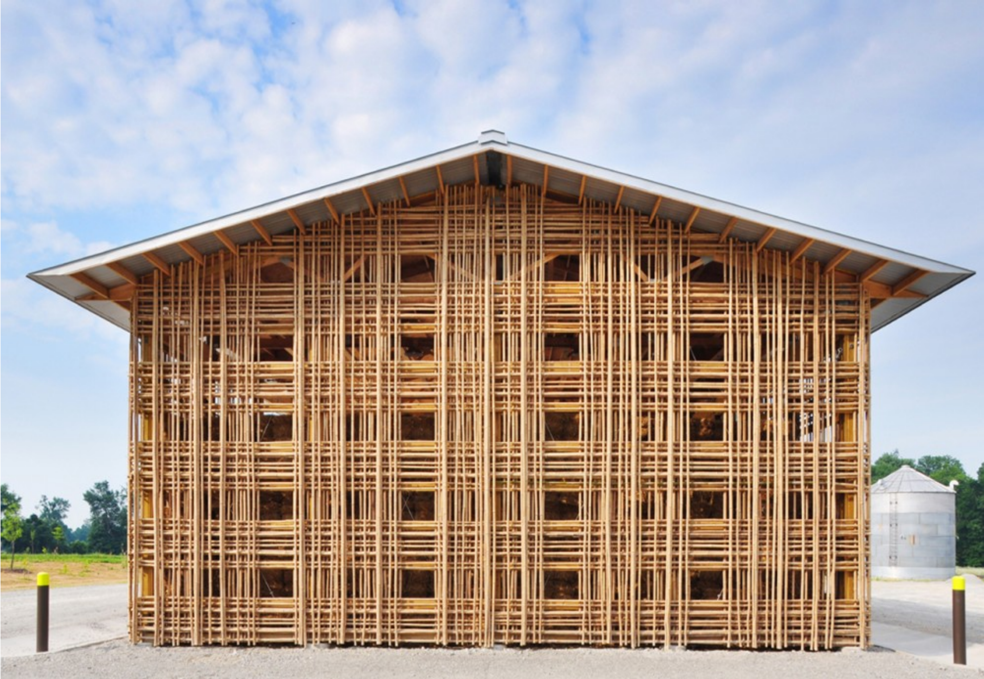
Mason Lane Farm • Goshen, Kentucky, USA • De Leon & Primmer Architecture Workshop • 2009 •