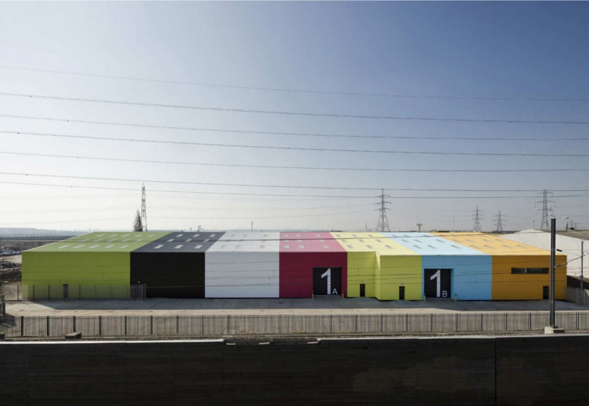
Wildspace Raktárcsarnok • Rainham, London, UK • Alison Brooks Architects • 2010 •