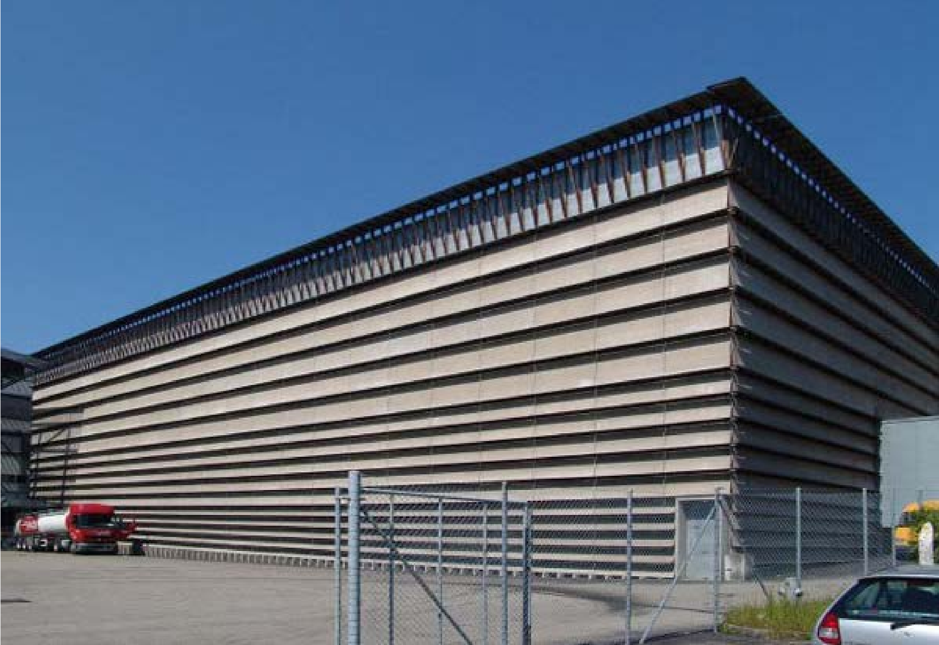
Ricola Édességgyár raktár • Laufen, Ch • J. Herzog & P. De Meuron • 1987•