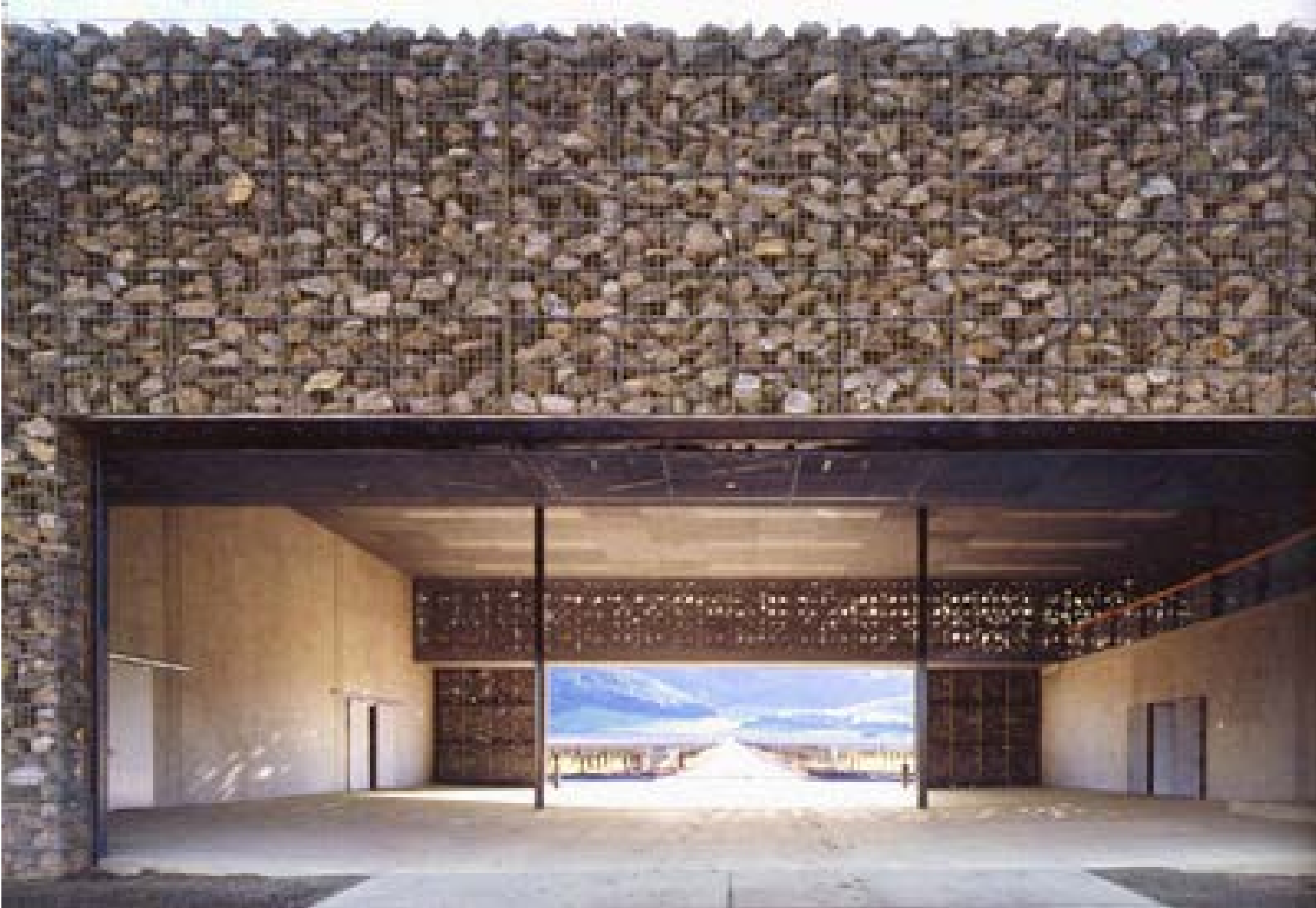
Dominus Borászat • Yountville , Napa Valley , Kalifornia USA • J. Herzog & P. De Meuron • 1996-98 •

Dobai János DLA egyetemi docens, tanszékvezető, BME Ipari és Mezőgazdasági Építettervezés Tanszék 2013