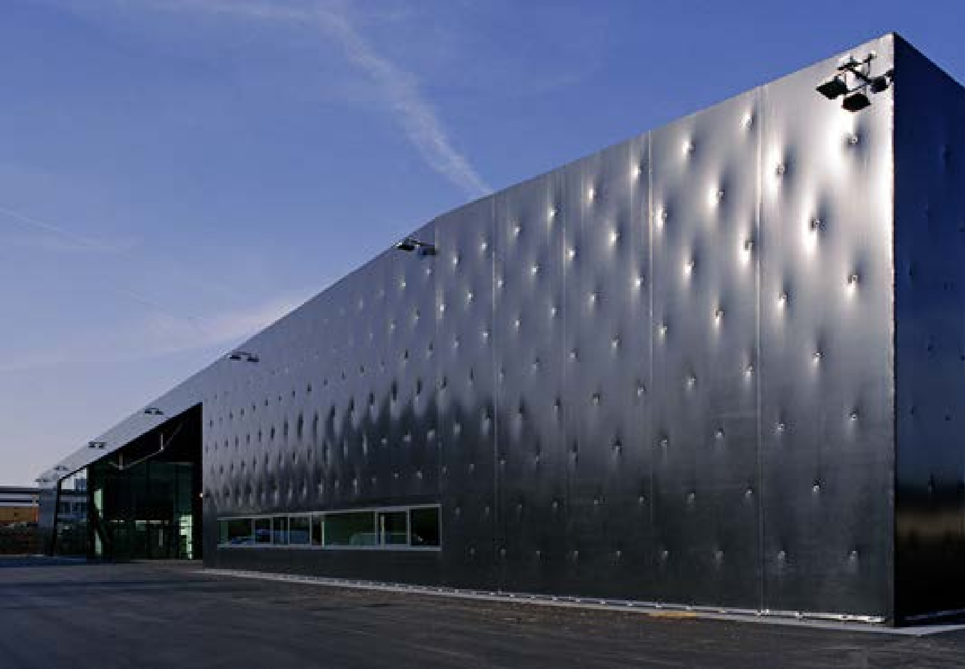
Hulladékhasznosító Üzem • Linz-Ansfelden, A • Caramel Architekten • 2006 •