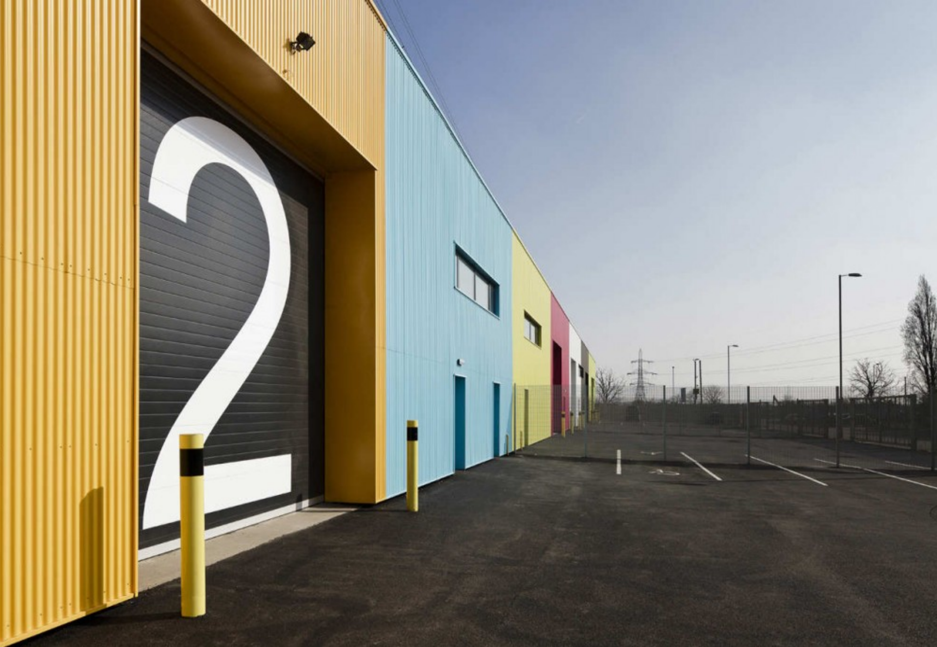
Wildspace Raktárcsarnok • Rainham, London, UK • Alison Brooks Architects • 2010 •