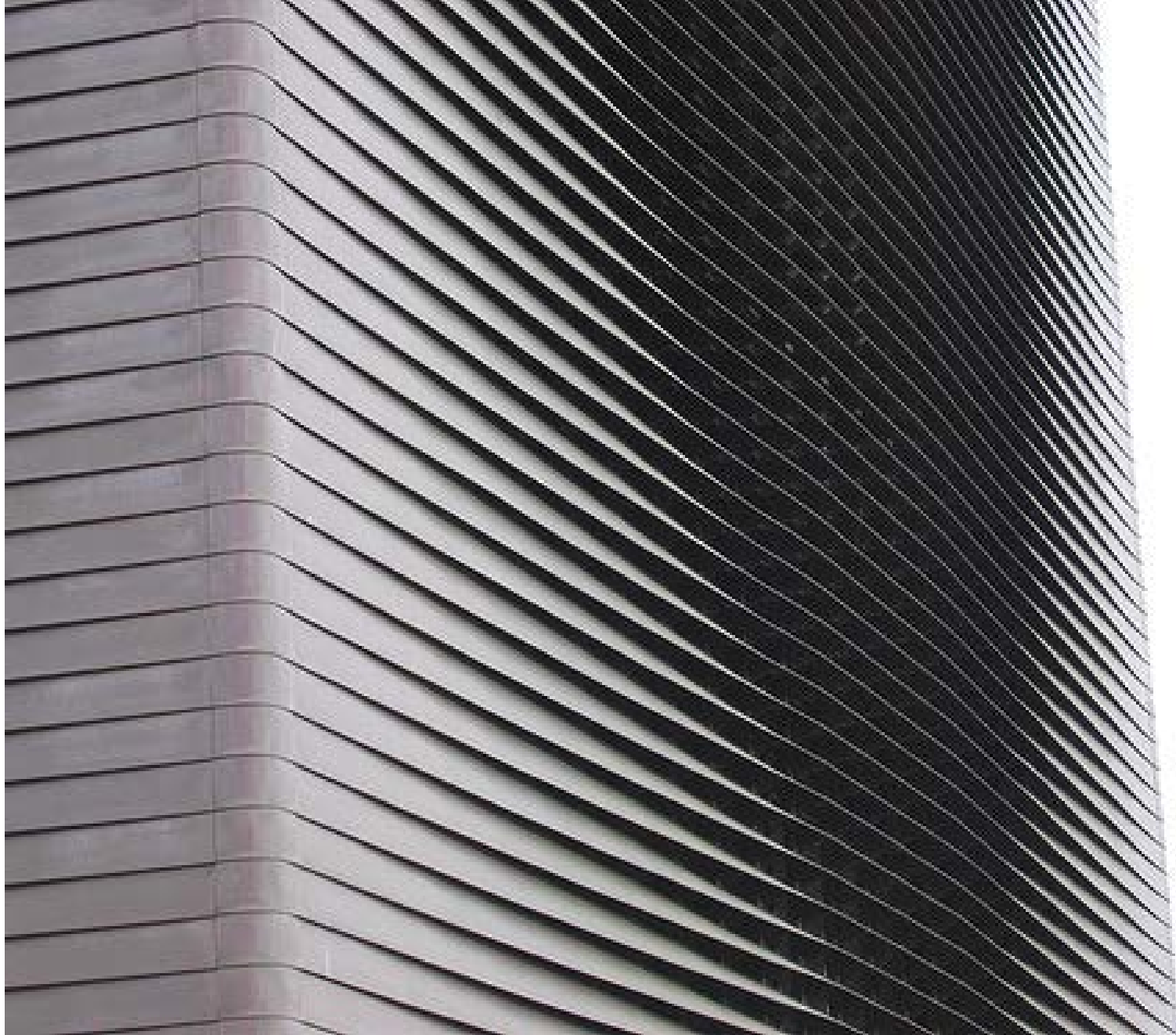
Signal Box (irányító épület) • Basel, Ch • J. Herzog & P. De Meuron • 1990 •