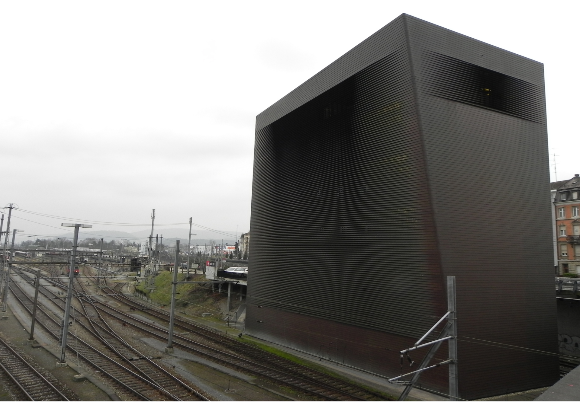
Signal Box (irányító épület) • Basel, Ch • J. Herzog & P. De Meuron • 1990 •