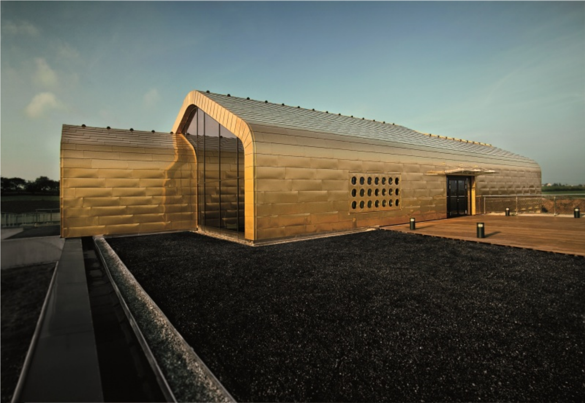
Mellékhatások: anyag fétis: VITARIUM tejgyár interaktív látogatóközpontja • Bissen, Luxemburg • Studio klv, Berlin • 2010 •