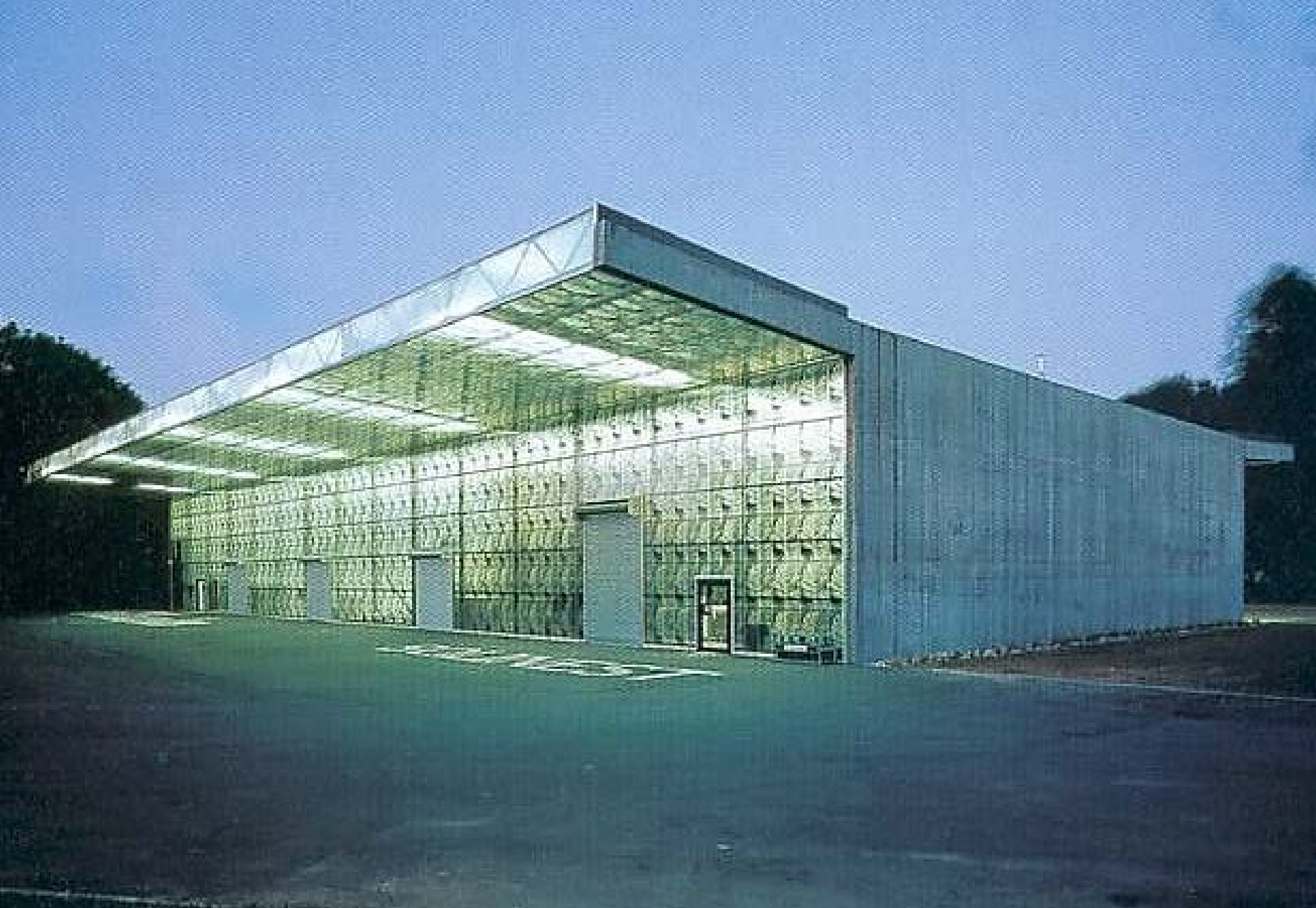
Ricola Europe Édességgyár raktár 2 • Mulhouse, F • J. Herzog & P. De Meuron • 1995•