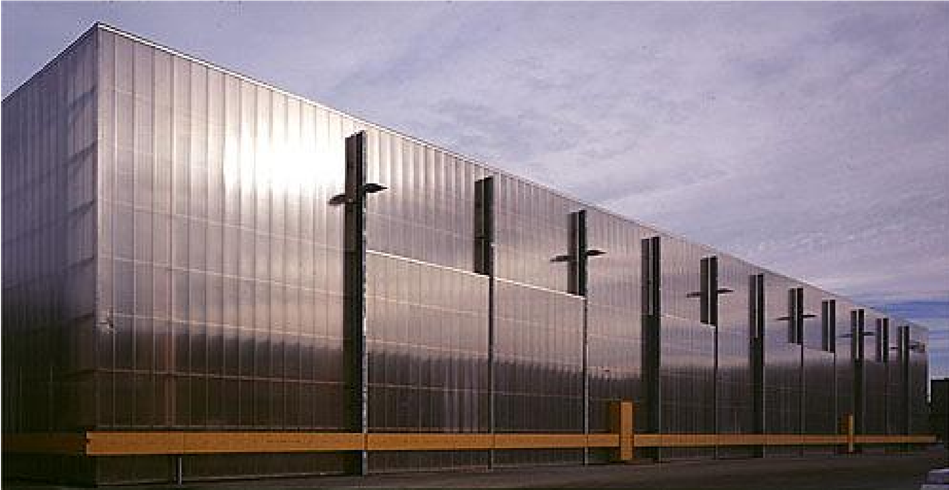
Kufmann Fafeldolgozó Üzem raktára • Bobingen, D • Florian Nagler Architekten • 2001 •