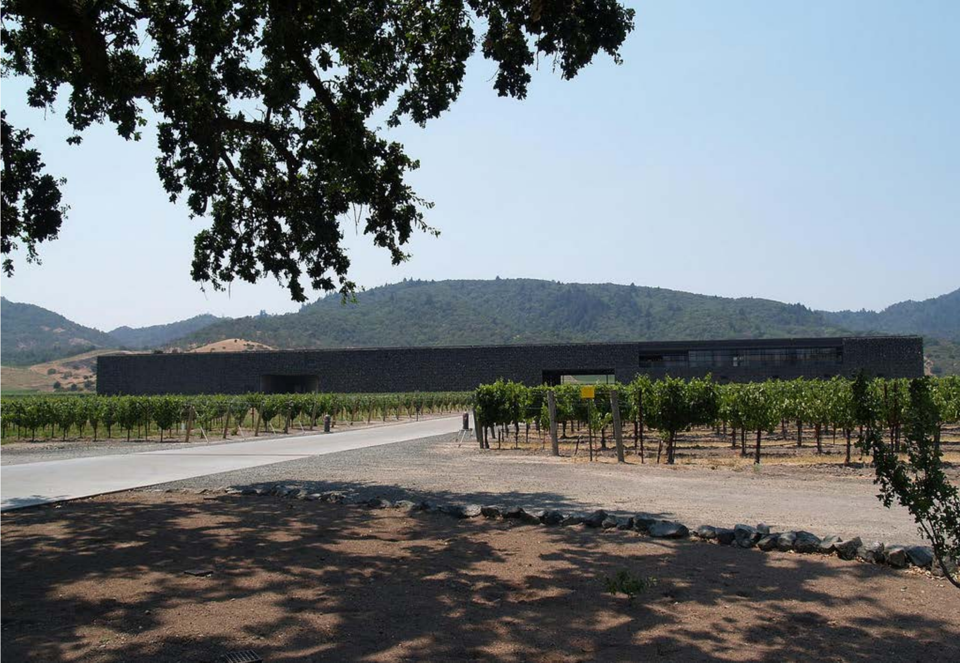
Dominus Borászat • Yountville , Napa Valley , Kalifornia USA • J. Herzog & P. De Meuron • 1996-98 •